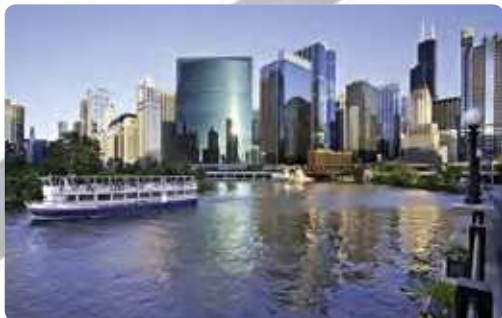
Chicago River et Willis Tower

Jour 2 > Les méandres du Mississippi vous mène jusqu'à Saint-Louis baptisée par les français en l'honneur du roi de France. Au bord du fleuve, l'arche de Saarinen symbolise la porte de l'ouest. Le musée au sous-sol est remarquable. Il retrace l'histoire des explorations et des migrations qui ont fait la Conquête de l'Ouest depuis Lewis et Clark envoyés par Thomas Jefferson à la découverte des territoires achetés à la France en 1803. 📍 275 miles vers Saint-Louis ★ Montez au sommet de l'arche pour une vue imprenable sur la cité et le fleuve. Si vous aimez les animaux, rendez-vous au Lone Elk Park avec bison et wapiti. Le visitor centre du Route 66 State Park met bien en valeur le patrimoine de la fameuse route. 🌐 www.koa.com/campgrounds/springfield-route-66/