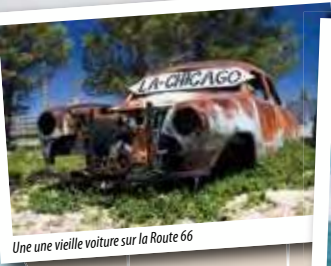
Une vieille voiture sur la Route 66