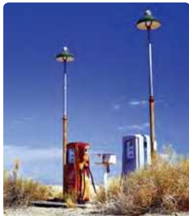
Une station d'essence dans le désert

Jour 12 > Admirez le barrage Hoover formant le Lac Mead sur le Colorado et marquant la frontière entre l'Arizona et le Nevada. Contournant les Providence Mountains, vous pourrez faire un crochet dans le sauvage et hostile Mojave National Preserve pour retrouver le tracé de la 66. 📍 155 miles vers Barstow ★ Le Mojave National Preserve propose une immense étendue de désert : dunes de sables, cônes de cendre volcaniques, arbres de Josué gigantesques, cactus et fleurs sauvages à volonté. Dans les replis de ses canyons et de ses montagnes, on tombe sur un ranch en ruines, une mine abandonnée, les vestiges d'un fortin en adobe. 🌐 www.koa.com/campgrounds/barstow/