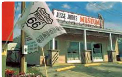
Jesse James Museum, Stanton, Missouri

Jour 15 > La Route 101 vous mène au KOA de Santa Margarita Lake. On trouve que la région de Santa Barbara a un air de Côte d'Azur. Plages, restaurants ou vignobles peuvent en témoigner de même que les églises et bâtiments de style méditerranéen. 📍 240 miles vers Santa Margarita ★ Vous serez étonné par les superbes autant qu'énigmatiques peintures rupestres ornant la Chumash Painted Cave remontant au XVIe siècle. 🌐 www.koa.com/campgrounds/santa-margarita/