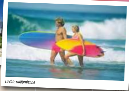
La côte californienne

miles plus au nord. Il est doté d'une ferme avec ses vaches, moutons, ânes, chèvres et faisans qui plaît beaucoup aux enfants. Il organise des excursions quotidiennes à San Francisco de mai à octobre. Une deuxième nuit permet d'explorer les vignobles ou la côte. 📍 115 miles vers Petaluma ★ Réservez longtemps à l'avance pour voir de près Alcatraz, l'occasion de points de vue imprenables sur la ville, la baie et ses ponts. Traversez à vélo le pont du Golden Gate et rentrez par le ferry de Sausalito, une belle balade bien aérée.