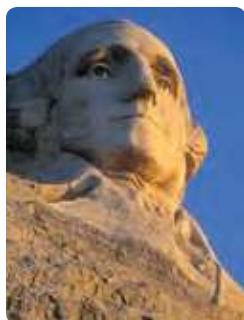
Mt Rushmore