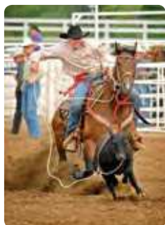
Rodeo Photo: South Dakota Tourism

Jour 7/8 > L'entrée orientale du Yellowstone National Park est au bout du Shoshone Canyon. Grant Village et le camping sont 40 miles plus loin en suivant la rive du lac parsemée de geysers sous marins. Ne vous étonnez pas du trafic voire des bouchons. Tout le monde s'arrête dès qu'un animal est en vue ! Elans, wapitis, bison sont assez cabotins. Prenez la direction de Old Faithful, seul geyser du parc dont les éruptions se produisent à heure fixe. C'est l'une des merveilles de ce parc exceptionnel qu'il faut prendre le temps de découvrir. 📍 100 miles vers le camping de Grant Village au Yellowstone National Park, en général ouvert du 3ème week-end de juin au 3ème week-end de septembre ★ Ne manquez pas le Grand Canyon de la Yellowstone orné de deux chutes d'eau spectaculaires ni les terrasses de Mammoth Hot Springs. 🌐 www.travelyellowstone.com/grant-village-campground-253.html