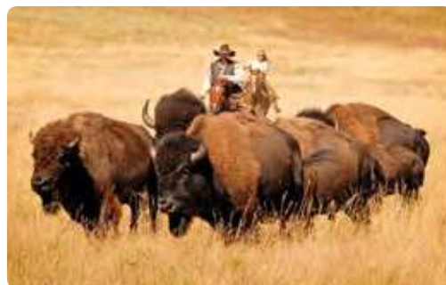
CSP Roundup