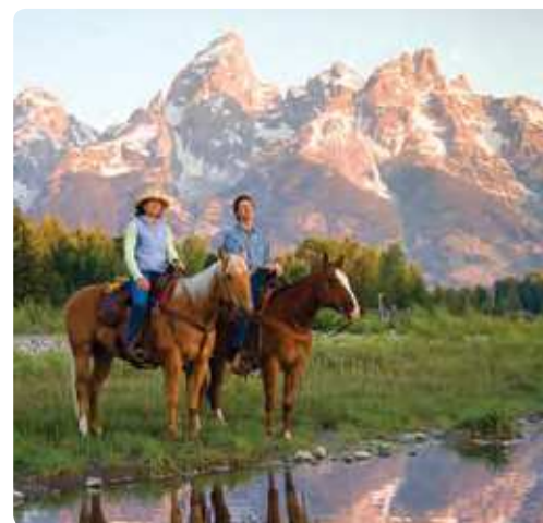
Équitation dans le Grand Teton National Park