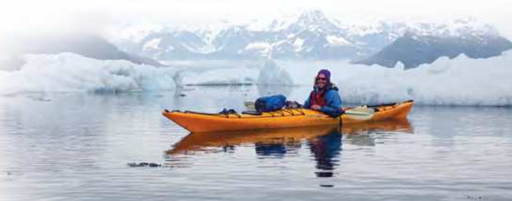
Kayak près de Valdez.