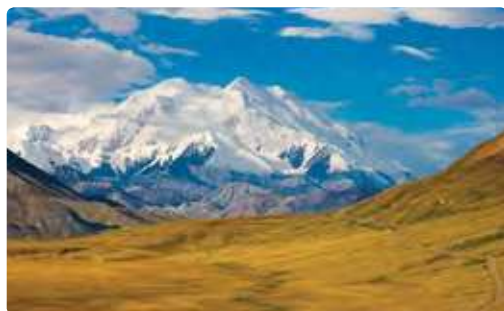
Denali NP avec Mt. McKinley au fond