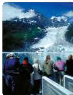
Prince William Sound