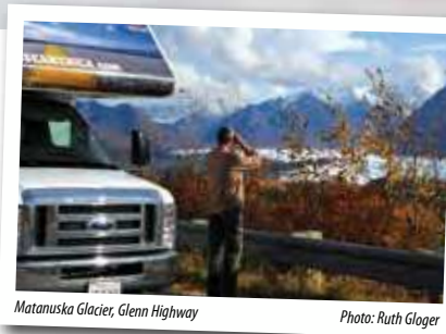
Matanuska Glacier, Glenn Highway